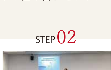
企業別快眠セミナー