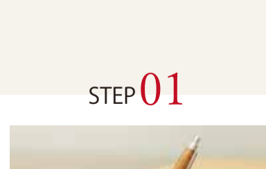
睡眠アンケートの実施